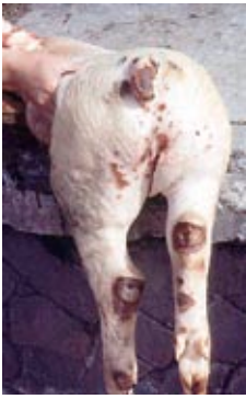
La caudofagia es una conducta anómala de etiología multifactorial que se manifiesta con la mordedura de la cola.