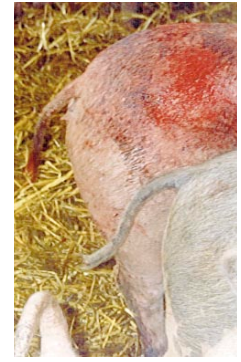
La presencia de heridas con sangre incita a una mayor intensidad de las mordeduras.

Otra pregunta que cabe hacerse es por qué la caudofagia se inicia por un determinado animal o a lo sumo por unos pocos de todos los presentes, pues bien, para este interrogante no tenemos una explicación científica, pero sí se ha observado que una vez iniciada la caudofagia se contagia rápidamente al resto de los individuos del corral e incluso a los de otros corrales, mediante un comportamiento de imitación. De tal manera que podríamos